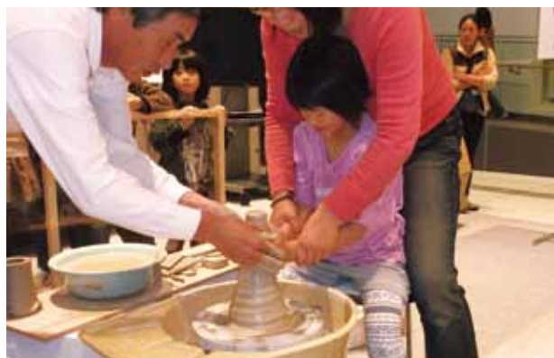
伝統的工芸品づくり体験風景 その2

※紹介事業は一例です。その他の事例を含め詳しい情報は、RING!RING!プロジェクトホームページに掲載しております。ぜひご覧ください。