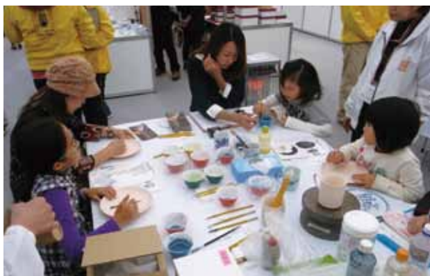
伝統的工芸品づくり体験風景 その1