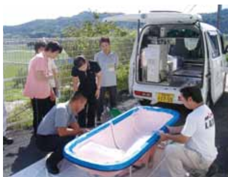
訪問入浴車 入浴サービス設備

移送車1 「助手席リフトアップ」又は 「セカンドシートリフトアップ」 のいずれかの装備