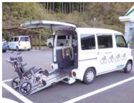
移送車2 車いす仕様 (スロープ式)