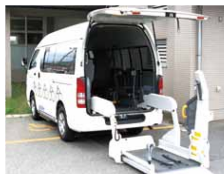
移送車3 車いす仕様(リフト式)

※紹介事業は一例です。その他の事例を含め詳しい情報は、 RING!RING!プロジェクトホームページに掲載しております。ぜひご覧ください。