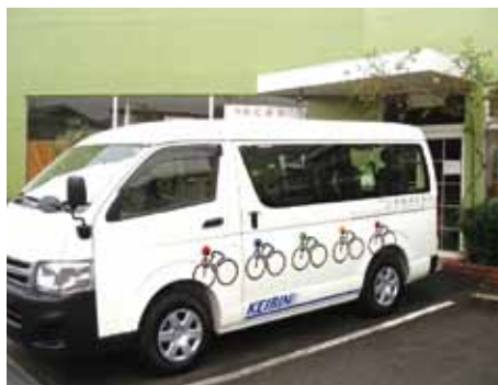
移送車4 送迎用の乗用車で、 乗車定員7人以上、 10人以下の車両