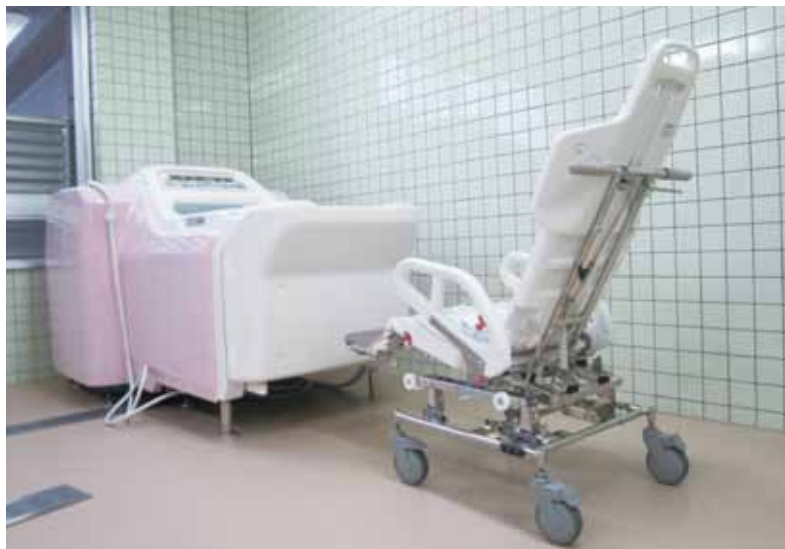
介護浴槽(左側)と搬送車(右側)