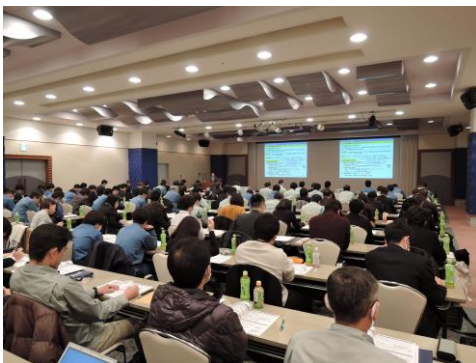
岡山会場受講風景