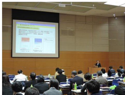
配布したテキストをスクリーンに映写し講演