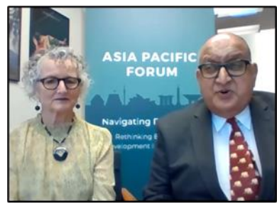
開会挨拶 NZIIA会長 Satyanand氏（右）