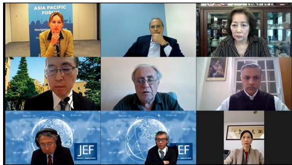
オンライン会議の様子（セッション3）