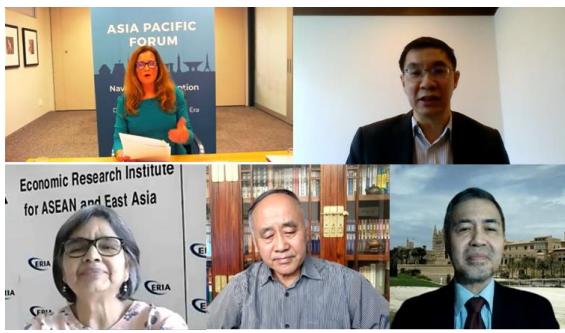
オンライン会議の様子（セッション1）