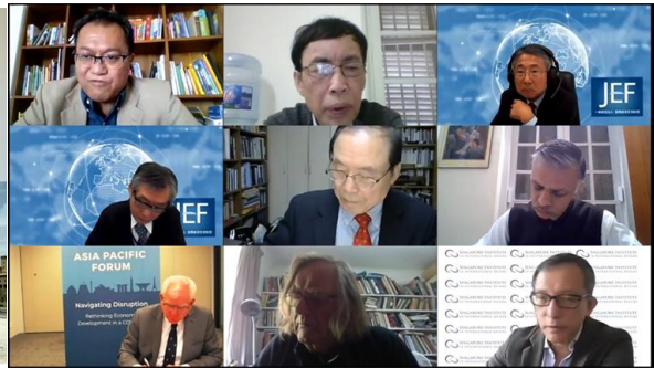
オンライン会議の様子（セッション2）