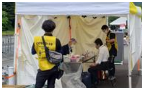
2021 Tour of Japan 検温所 再検温者への問診の様子