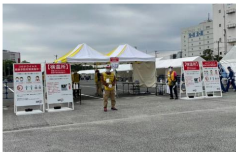
2021 Tour of Japan 東京ステージ 会場検温所及び注意喚起看板