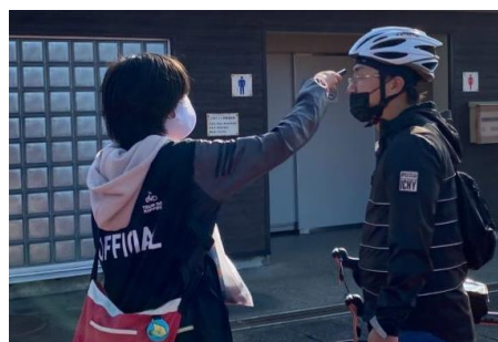
伊豆大島御神火ライド2021 参加者への検温の様子