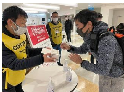
2022ハンドメイドバイシクル展 来場者への不織布マスク着用をお願い