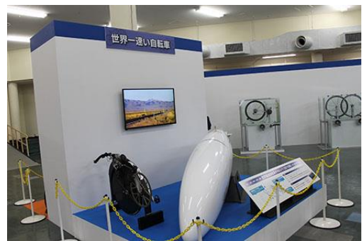
チャリンコ・サイエンス