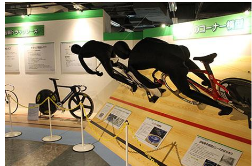
チャリンコ・レース