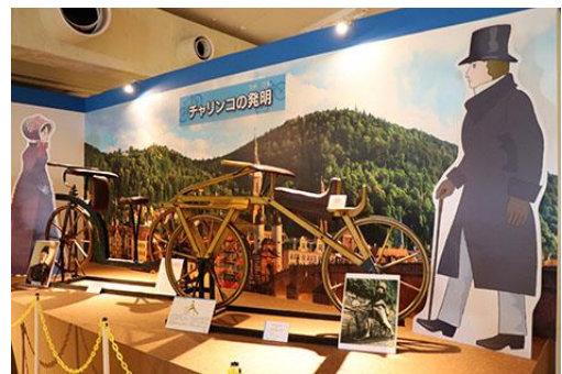
チャリンコヒストリー