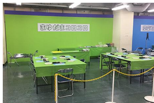
クラフト・パーク