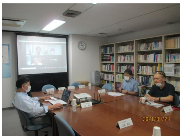
第2回研究会の様様