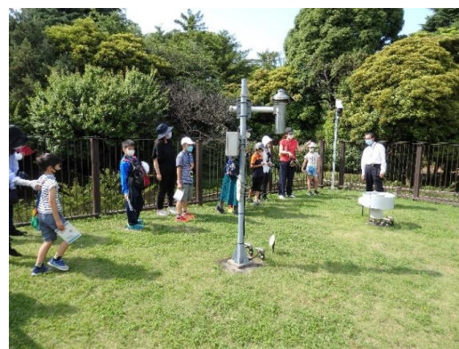
普段は立ち入れない北の丸露場の見学