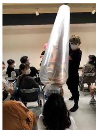
Dr. ナダレンジャーによる防災実験ショー