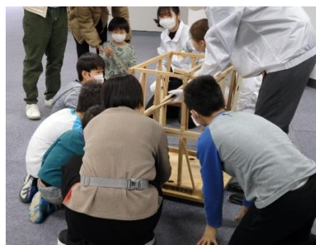
模型を使用して耐震に強い構造を考える