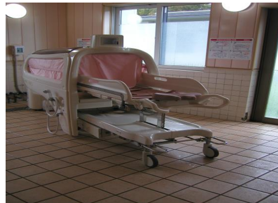
本体とストレッチャー