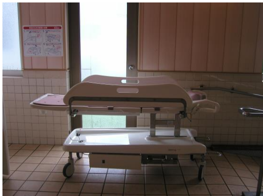
高さ調節式ストレッチャー