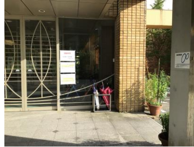
特別養護老人ホームディアコニア玄関