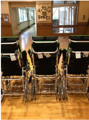
座面昇降型車いす