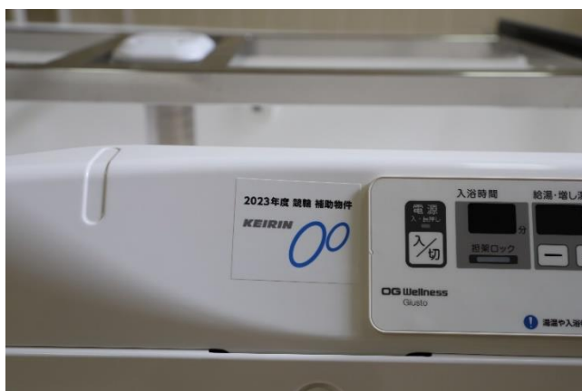
昇降式介護浴槽ジェスト