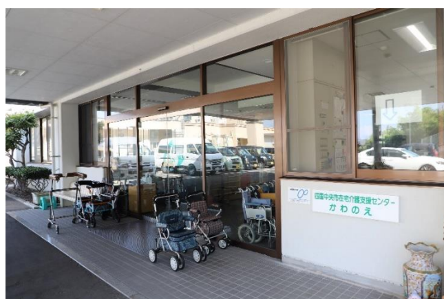
デイサービスセンターかわのえ玄関