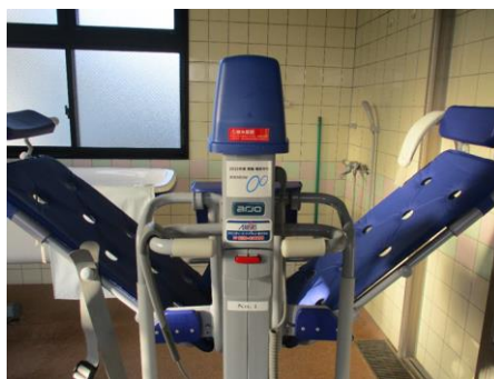
設置場所：【くまむた荘デイサービスセンター春秋館】