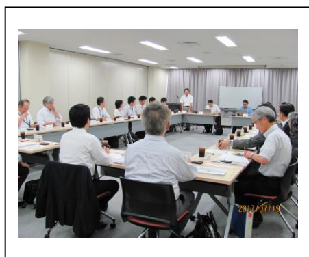
ロボット大賞審査・運営委員会