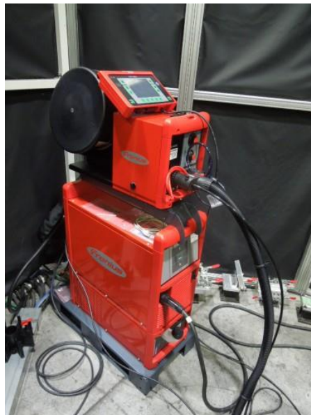
デジタルインバータ制御溶接装置

アーク溶接時の電流・電圧をデジタル制御し、溶込状態を安定化させることで、品質の良い溶接を行うことができる装置です。溶接ワイヤの加熱制御機能を有しているため、工具鋼など予熱温度の管理が重要な難溶接材料や、溶接材料本体を溶かさないうちでの使用など、幅広い材料や製品形状での使用が可能です。