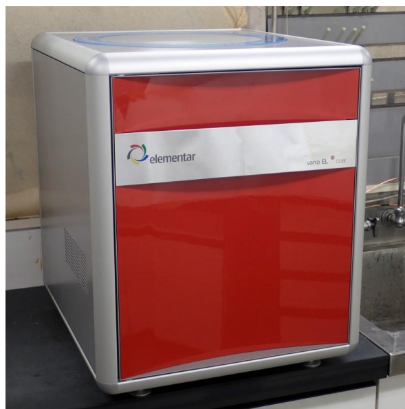
全自動元素分析装置

有機物をはじめとする多くの物質の基本構成元素である炭素、水素、窒素、硫黄、酸素を定量分析する装置で、粉体または液体試料の分析が可能です。炭素、水素、窒素、硫黄は1回の測定で同時に分析できます。80検体のオートサンプラーが装備され、効率の良い分析が可能です。