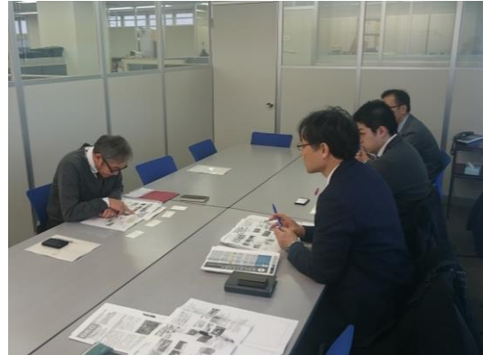
写真-9 ㈱セントラルパーク (平成30年1月29日 実施)