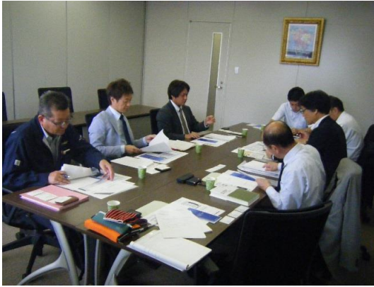
写真-4 福岡地下街開発㈱ (平成29年10月3日 実施)