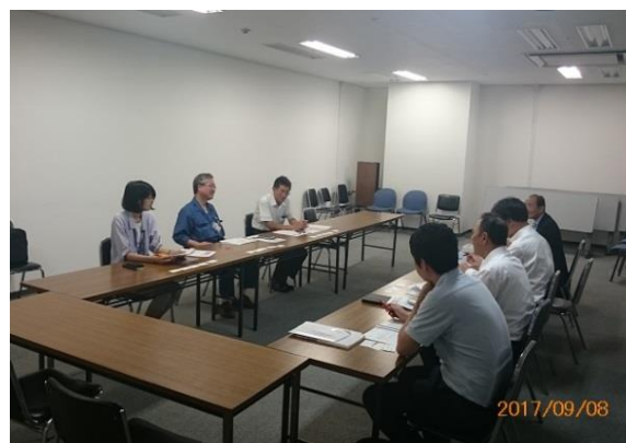
写真－3 大阪市建設局ヒアリング調査 (平成29年9月8日 実施)