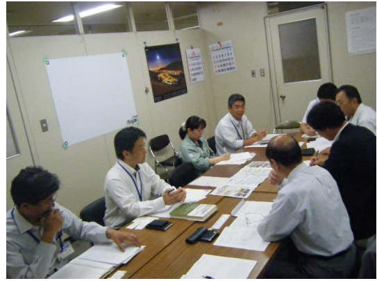
写真-5 福岡市交通局 (平成29年10月3日 実施)