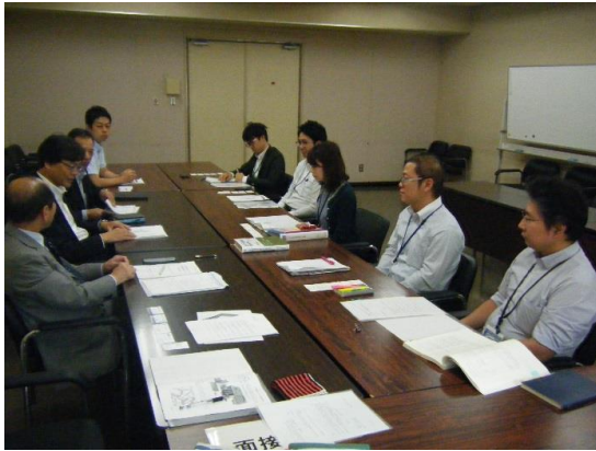
写真-6 福岡市道路下水道局 (平成29年10月4日 実施)