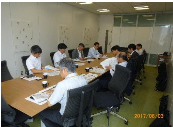
写真－1 森ビル㈱ヒアリング調査 (平成29年8月3日 実施)

では、当面は導入を考えていないところが多かった。しかしながら、地下鉄の運営会社では、新設される地下通路などについて、関係者の合意形成のために、3Dモデルを使った資料を作成していて、3Dデータの活用を既に行っているところもあった。