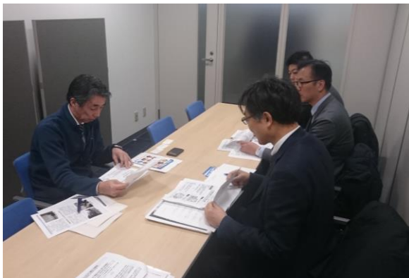
写真-8 ㈱エスカ (平成30年1月29日 実施)