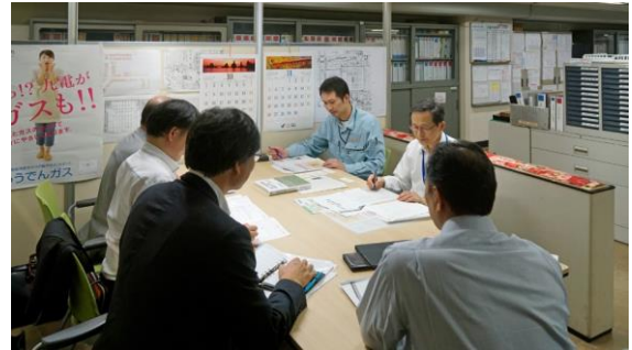
写真-7 ㈱博多ステーションビル (平成29年10月4日 実施)