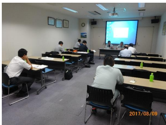
写真－2 ㈱北海道熱供給公社 (平成29年8月9日 実施)