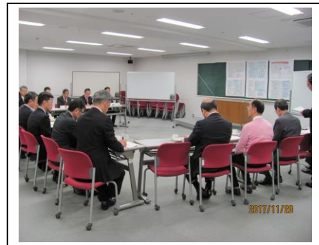
会合での検討風景（ブレインストーミング）