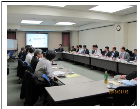
会合風景（講師による講演）

IoT・AI など製造業を取り巻く環境要因とその動向を分析することにより、ものづくりと人の役割に及ぼす影響を展望し、機械工業としての対応課題と人材の問題を明らかにすることを目的に検討した。ITとOT（ものづくり）の両面から両者融合の力が働く中で、部会メンバーによる生産現場や開発設計現場の現状と課題の認識から論点を抽出し、IoT・AI時代に目指すべき方向、求められる人材や層別対策、残された課題について明確にした。