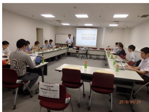
委員会での専門家との情報交換