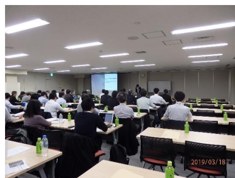
セミナーでの専門家の講演