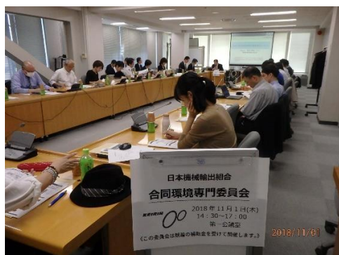
委員会での専門家との情報交換