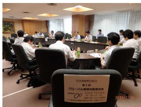
委員会での専門家との情報交換