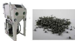
図1 プロワ式ブラスト装置と研磨材

弾性体の母材に微小な砥粒を担持させた特殊な研磨材を使用した精密研磨用（プロワ式）ブラスト装置（本事業で導入、図1参照）により、積層モデル（インクジェット式光造形機にて造形）の表面研磨の実験を行い、研磨条件（研磨材の粒度、研磨回数）と表面粗さの関係について基礎的なデータを収集した。