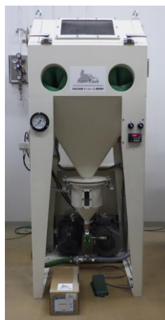
図1 精密研磨用ブラスト研磨装置

※ 小さな球状投射材を金属表面に投射することにより表面に圧縮の残留応力を付与させる方法で、部品の寿命や健全性を向上させる効果がある。