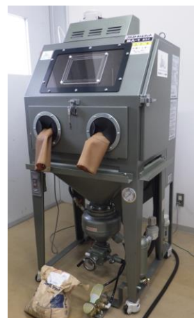
図2 直圧式ブラスト研磨装置