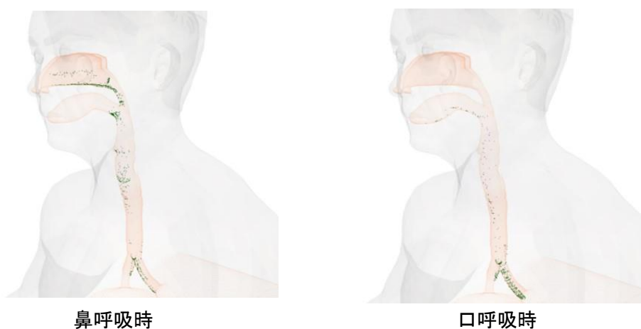
図1 呼吸方法の違いによるウイルス着地ポイントの比較

人が吸い込んだウイルス飛沫は気道内もしくは肺に到達する。インフルエンザでは季節性のものはレセプターの形状から喉に着床した場合に感染のリスクが高くなり、鳥インフルエンザについては肺に着床した場合に感染しやすいとされている。よって気道内におけるウイルスの振る舞いを解析することは、ウイルスの特性を踏まえた上で非常に重要であると言える。例えば鳥インフルエンザのパンデミックの時は肺に到達する経路を追えば良いことになる。本研究では鼻呼吸と口呼吸についてそれぞれ流体シミュレーションを行った。50ミクロンの飛沫約1万個を鼻や口の入り口に配置し、吸気と排気を5回繰り返した後に気道内に付着したウイルスを図1に示している。