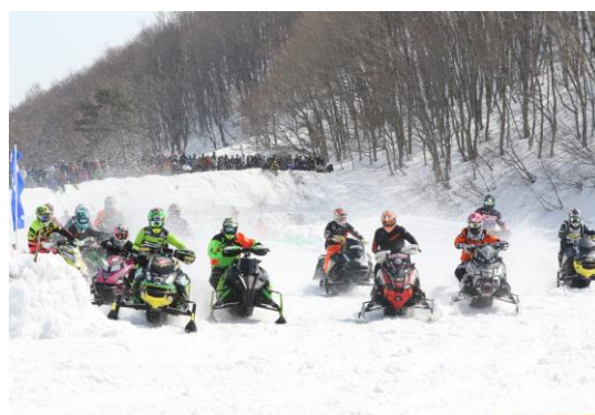
■スノーモービル競技