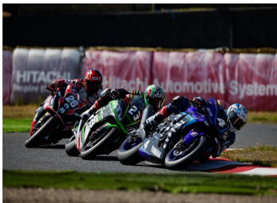
■ロードレース競技