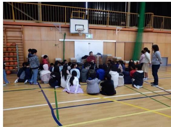
アスリートと触れ合う（対話）