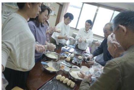
まつど暮らしの保健室 おにぎりアクション