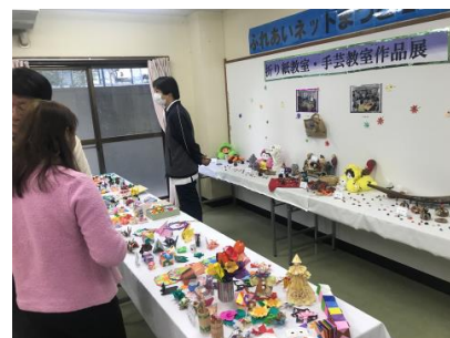
秋の作品展 折り紙&手芸