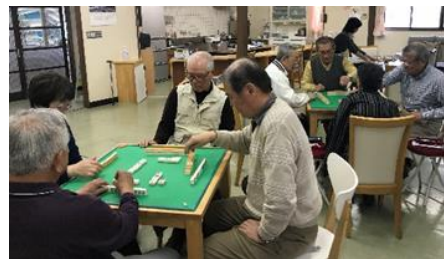
健康マージャンクラブ