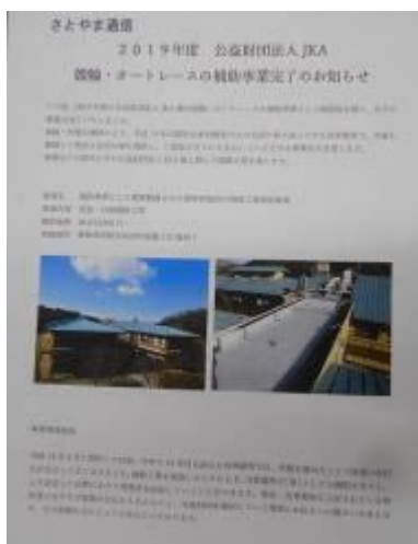
〈機関誌・施設内掲示板〉