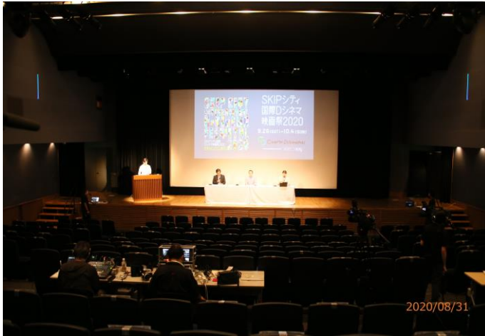
オンライン記者会見