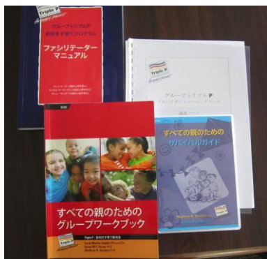
養成講座で使用したテキスト類