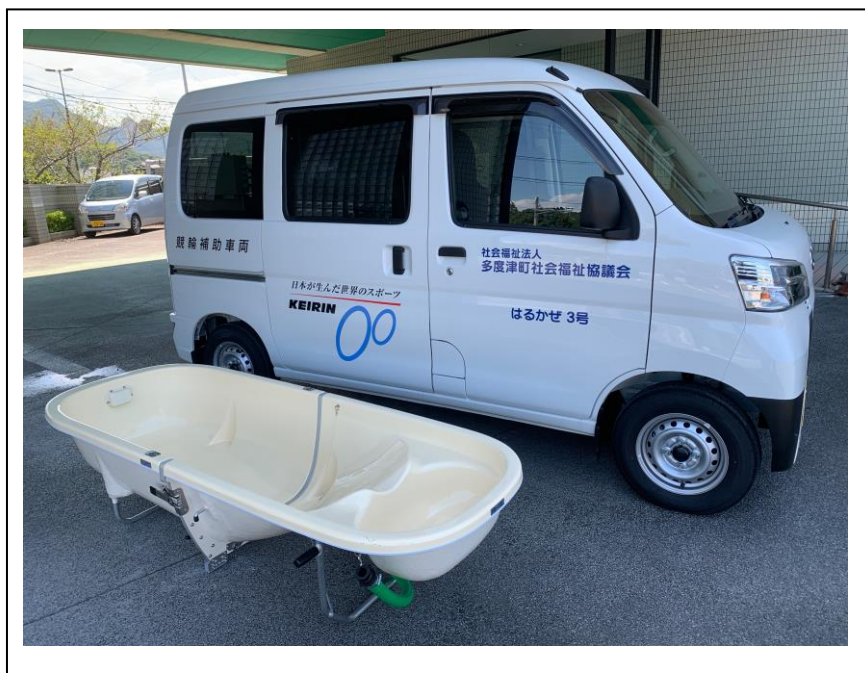
【訪問入浴車の右側と分割浴槽】