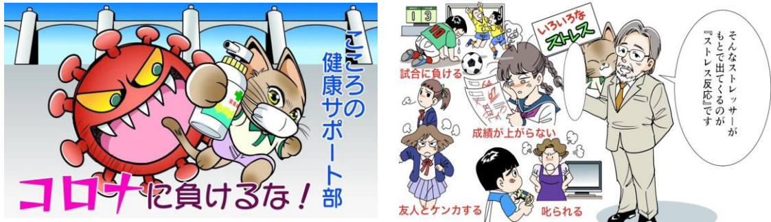
制作したマンガ動画「ガンバちゃんのお悩み相談室」