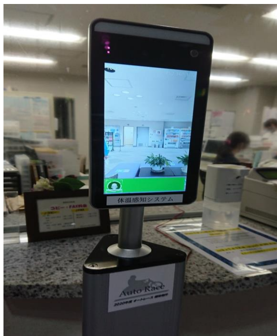
体温感知サーマルタブレットの写真