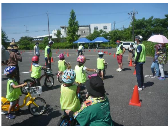
自転車教室の様子-1

2021年7月24日から8月7日までピエリ守山会場で計3回、11月14日から11月27日まで北近江リゾート会場で計3回、12月25日から2022年1月15日までピエリ守山会場で計3回、合計9回の教室を開催。