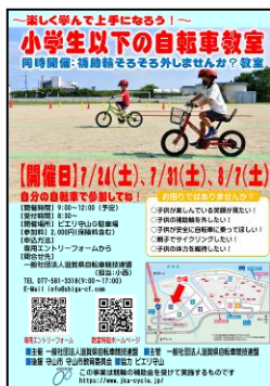
ピエリ守山夏ポスター、チラシ