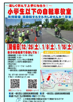
ピエリ守山冬ポスター、チラシ