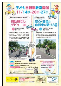
北近江リゾートポスター、チラシ