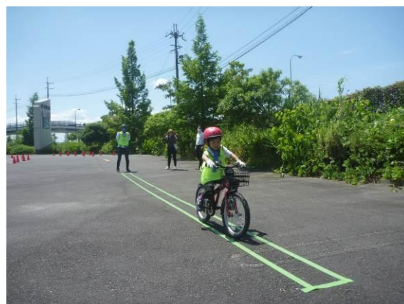
自転車教室の様子-1