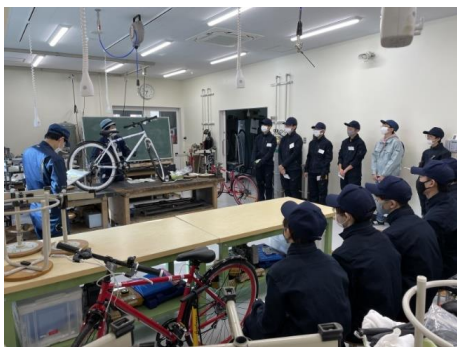
① メンター育成（全体説明）

高専の1年生33人を対象に、自転車の分解・組立方法（工具や測定具の使い方も含め）と自転車を大切に扱うためのメンテナンス方法を教え、メンターとなれる能力を育成した（4回×3時間）。続けて、小中学生を対象に自転車塾の公開講座を2回実施した（参加者13名）。