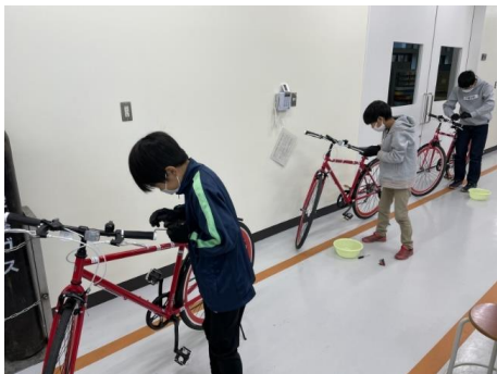
③ 公開講座（小学生以上対象）