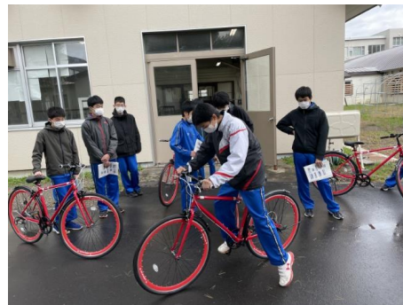
④ 公開講座（中学生対象）