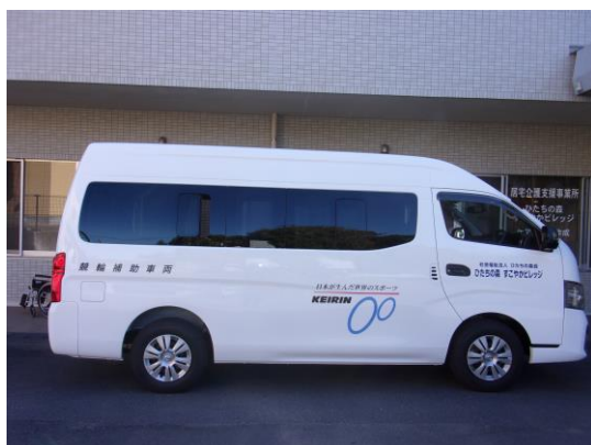
移送車3（日産キャラバン）の側面です。

移送車3[車椅子仕様(リフト式)] http://www.sukoyakavillage.com/img/jkahojo.pdf