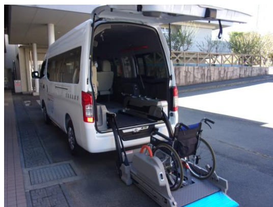
乗車したまま車椅子をリフトで乗せる事ができます。