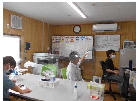
【機器を使用している具体的な写真】