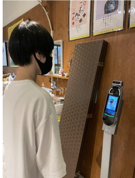
使用している様子