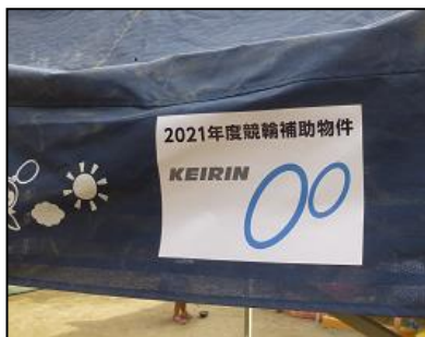
大型テント 園庭にて使用