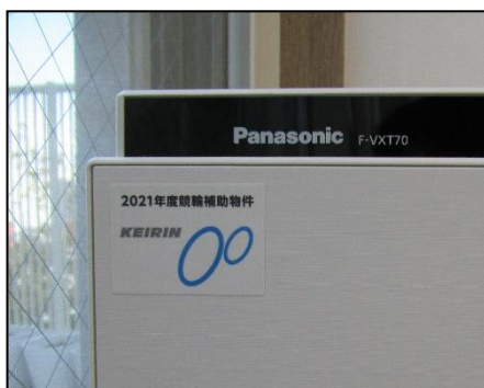
0歳児クラスにて使用