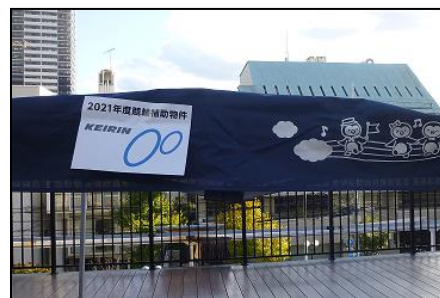
大型テント 3階屋上にて使用