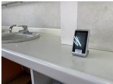
二酸化炭素計を購入。食堂に設置。