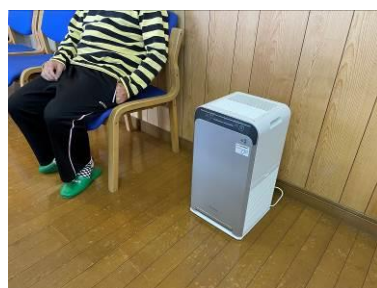
空気清浄機を購入利用者が主に過ごす旧館に設置。