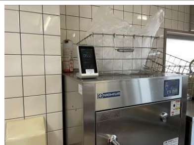
二酸化炭素計を購入。厨房に設置。