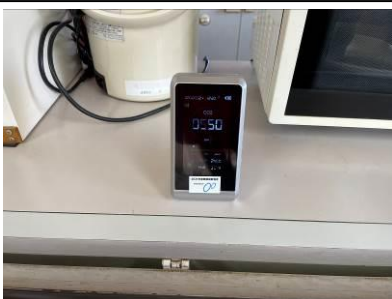
二酸化炭素計を購入。旧館に設置。