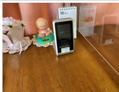
二酸化炭素計を購入。旧館事務所に設置。