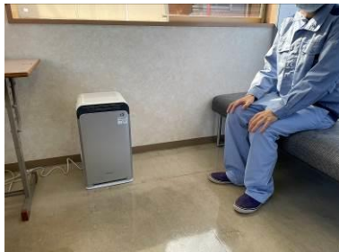
空気清浄機を購入利用者が主に過ごす新館に設置。

(URL) http://ww36.tiki.ne.jp/~miyukihiroba/index.html