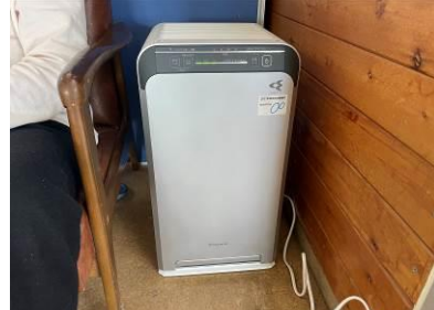
空気清浄機を購入し、利用者が主に過ごす食堂に設置。