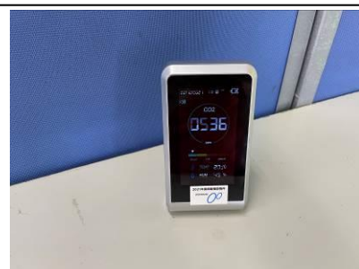
二酸化炭素計を購入。新館に設置。