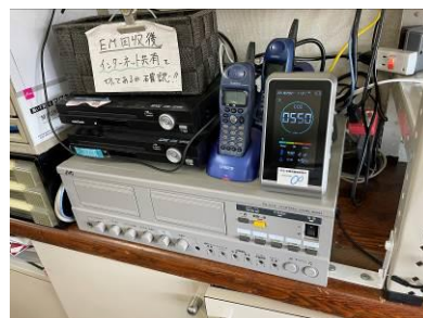
二酸化炭素計を購入。事務所に設置。