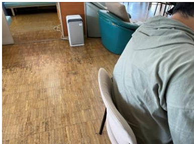
空気清浄機を購入利用者が主に過ごす作業場に設置。