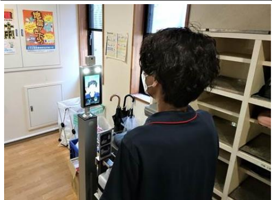
スタッフ通用口にて体温測定に使用