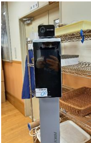
導入したサーモカメラ