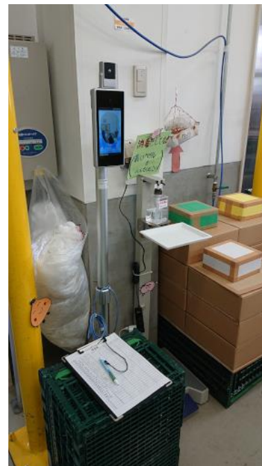
サニーズマーケット

② 障害児の事業所では、感染症対策を強化すべく児童が触れる備品、遊具等に空間除菌噴霧機を整備し、感染拡大防止に対応した。