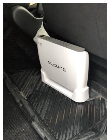
利用者送迎車内空気清浄機 2