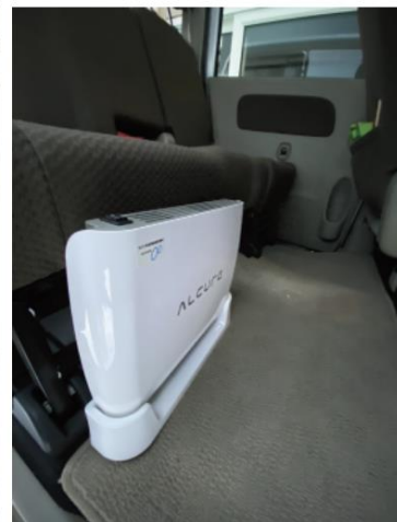
利用者送迎車内空気清浄機 1