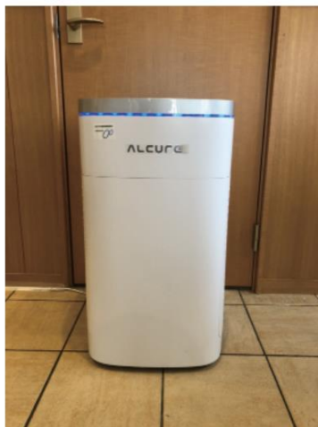
軽食喫茶 sakura 内空気清浄機