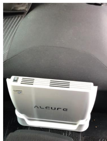
利用者送迎車内空気清浄機 3