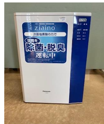
第2乙訓ひまわり園 職員室