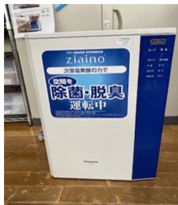
(本棟) 2階 作業室