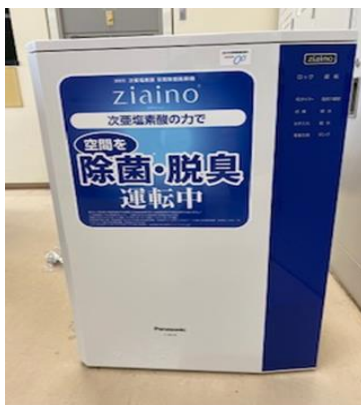
(本棟) デイセンター 職員室