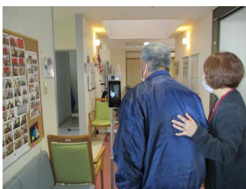
デイサービス利用者様の検温