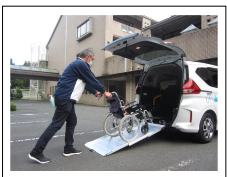
実際に使用している写真