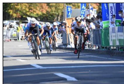
第3ステージフィニッシュ