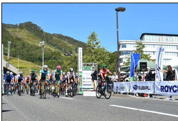
第2ステージスタート

また、自転車競技人口の裾野拡大、サイクルスポーツの普及・振興や近年のサイクルツーリズム推進の取組等と相まって地域の観光、産業の振興・活性化、自転車利用に係る道路交通環境の整備促進等にも寄与。