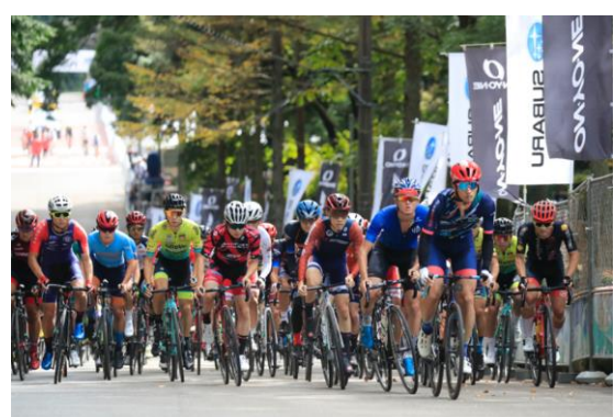
アマチュアレースの様子