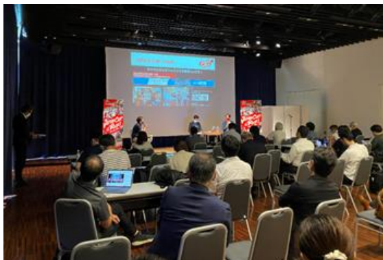
「記者発表会」の開催