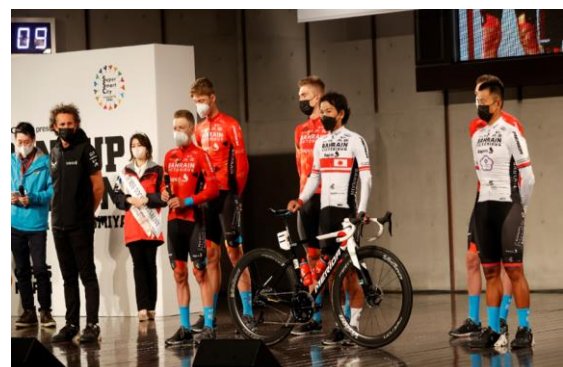
チーム紹介の様子