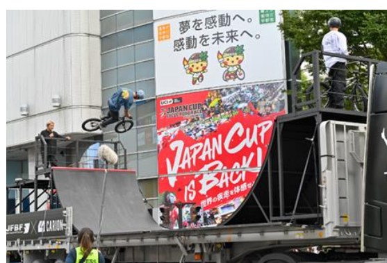
「BMXパフォーマンス」の実施