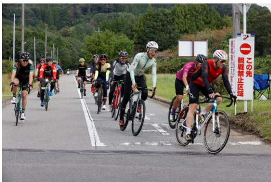
オープニングフリーランの様子