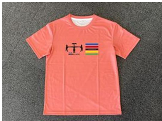
スタッフTシャツ500枚