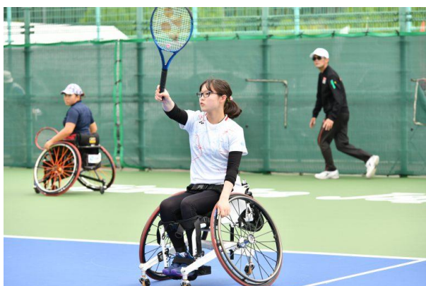
女子ダブルス決勝