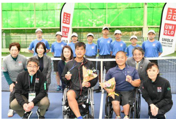
男子シングルス優勝者・準優勝者