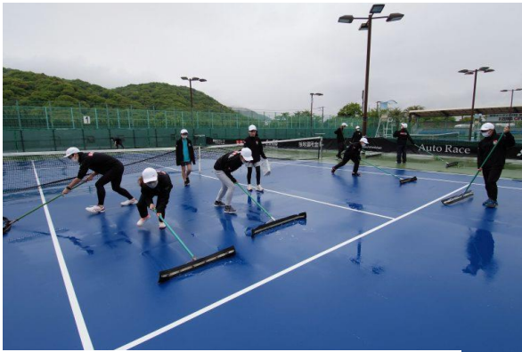
水はけをするボランティア