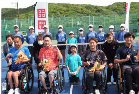
クアードダブルス優勝者・準優勝者