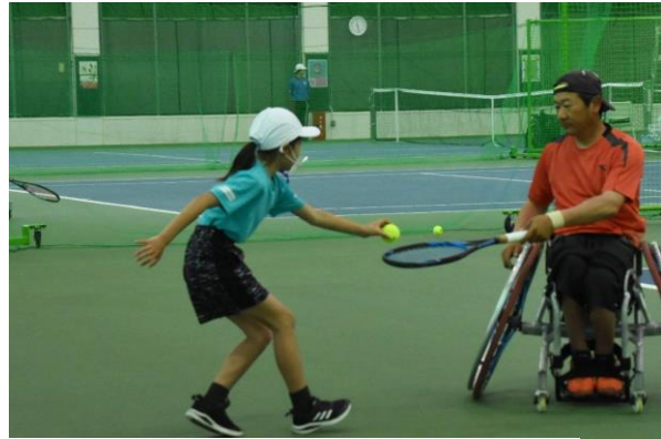
ボールパーソンの小学生