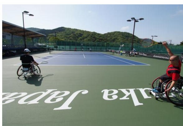
男子ダブルス決勝