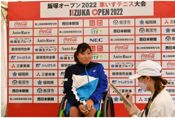
新聞社のインタビュー