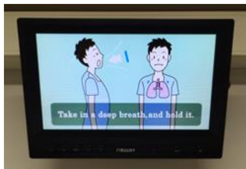
複数言語案内 (ナイスコール)