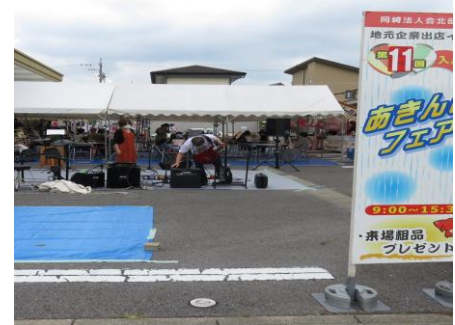
「工作教室」出展（岡崎）