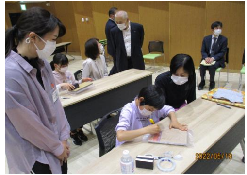
ホバークラフトの工作（三川）