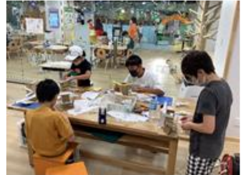
ピタゴラ作品工作（こまき）