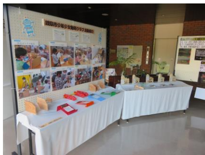
「クラブ作品展」（岐阜）