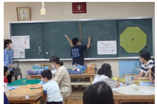
宇宙パラシュートの工作（北見）