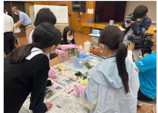
液体窒素による化学実験（新宮）