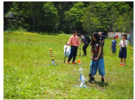
水ロケットの競技会（秋田市）