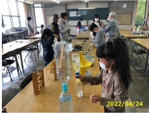
浮沈子の工作（西尾）