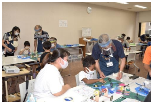
風力カーの工作（半田）