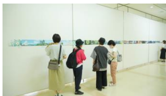
「平家物語」の彩 [いろ] 特別展示