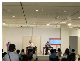
コンペティション作家トークライブ