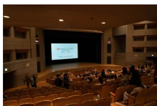
開会式会場の様子