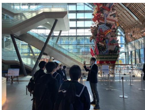
九州国立博物館訪問