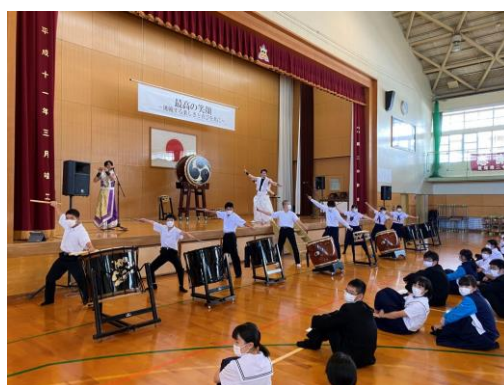
ジャパンマーベラス

ここ飯塚から日本を飛び出して国際的に活躍している和太鼓を中心とした和楽団ジャパンマーベラスの演奏を鑑賞し、その迫力ある演奏に感動するとともに、地域や自国へのアイデンティティーを高めた。