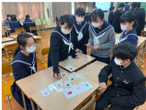
地域創生ワークショップ