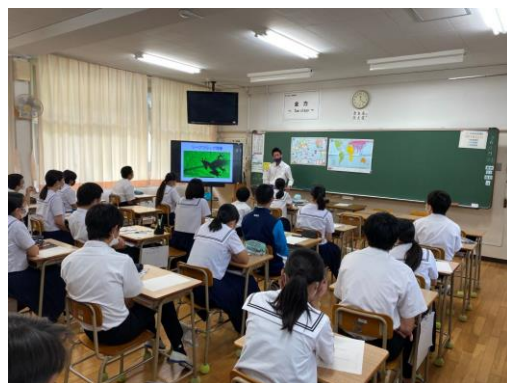
多文化共生ワークショップ