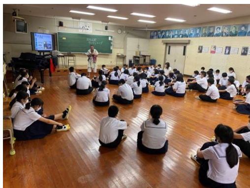
100人村ワークショップ